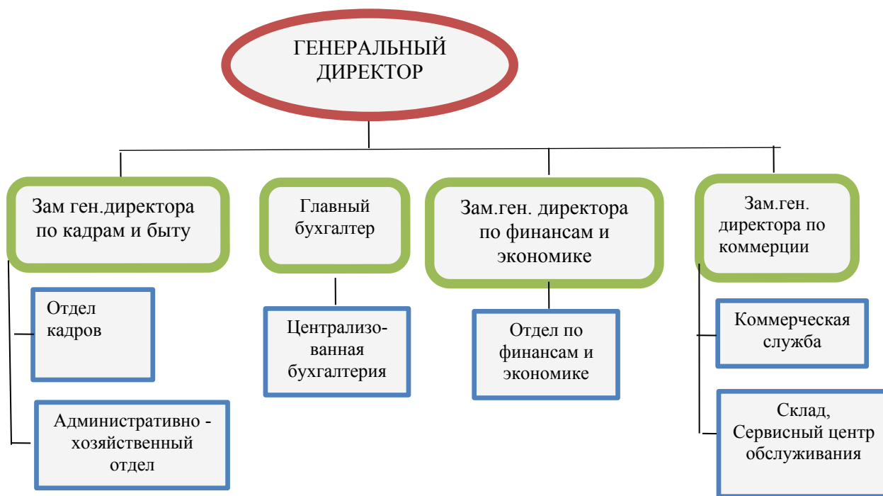
Рисунок 1 – Организационная структура управлением ООО «Химуглемет»

Организационная структура компании «Химуглемет» представлена на рисунке 1.